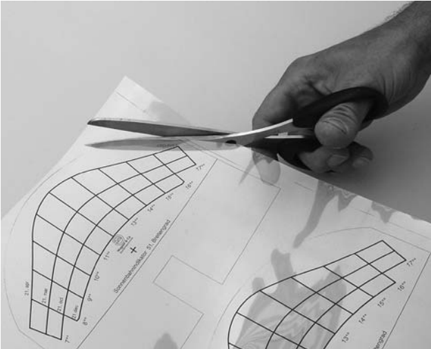
Bild 2 Die zutreffende Sonnenbahnfolie auswählen (51° Brg.= D, 48° Brg.= D-Süd, Österreich, Schweiz etc.), entlang den dünnen Markierungslinien ausschneiden und in den Edelstahlhalter einschieben.