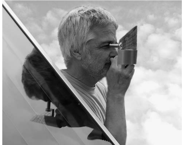
Bild 3 Den zukünftigen Standort der Solaranlage aufsuchen.