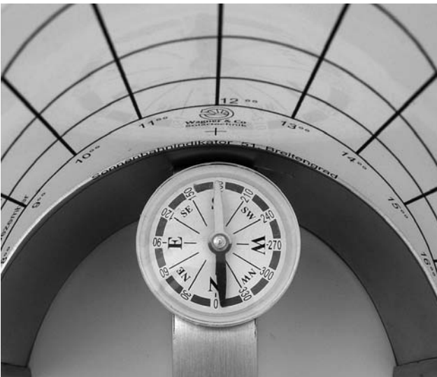
Bild 4 Den Sonnenbahnindikator mit dem Kompass nach Süden ausrichten und dabei möglichst waagrecht halten.