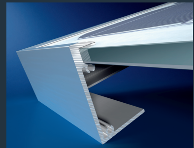
Rahmendetail der SME-1 Serie

Schüco SPV 180-SME-1 Maße: 1.580 x 808 x 46 mm Nennleistung ( P_{mpp} ): 180 W