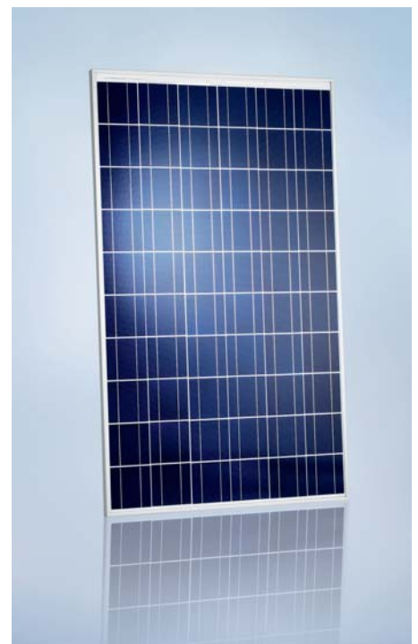
SCHOTT POLY™ 217/220/225/230/235