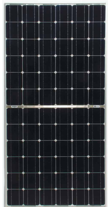
BP 7170S Maßstab 1:14

Lamine sind von "Underwriter's Laboratories" für elektrische Sicherheit und Brandschutz Klasse C anerkannt.