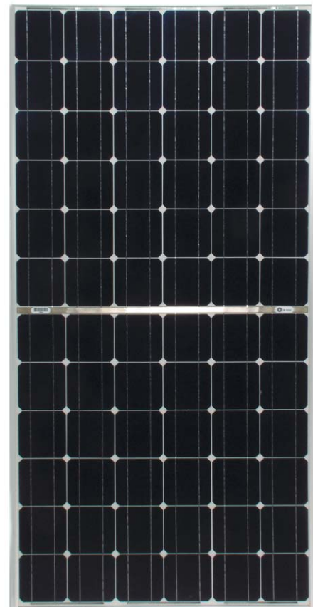
BP 7190S Maßstab 1:14

Gerahmte Module sind von "Underwriters Laboratories" für elektrische Sicherheit und Brandschutz Klasse C zugelassen.